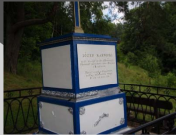
Tragisk kärleks-historia fick vi oss till livs, efter en låång trappa.