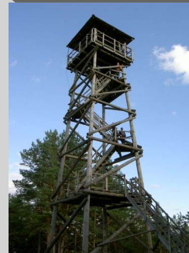
Vissa modiga gick upp alla trappor och belönades med en vidunderlig utsikt över floden Daugava