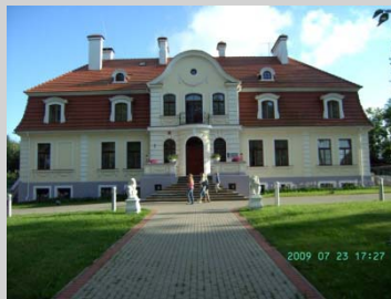
Svente Hotell ständsmässigt boende för en biker