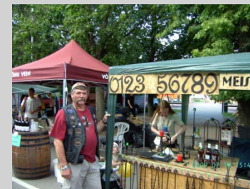
Vem i Vika kommer jag till om jag ringer det här numret