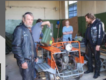
En Ural (BMW kopia) ombyggs till dressin. OBS It's called a kickstart It's how real men star there bikes

Undrar om montören eller konstruktören var fullast