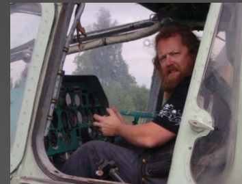
En sån här vill jag ha..... Tjongen är inne på att byta bort Titan Harleyn.