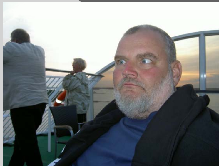
Jag vill komma Fram j....a båtresa