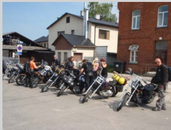
Framme i Tartu