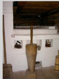
Vinterns bästa säng var ovanpå spisen