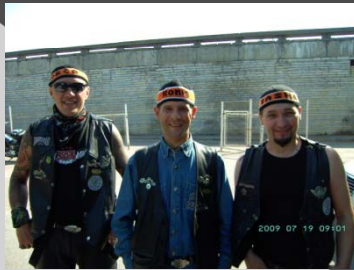
Framme i Tallin. Gu va gött med sånna vänner som välkomnar