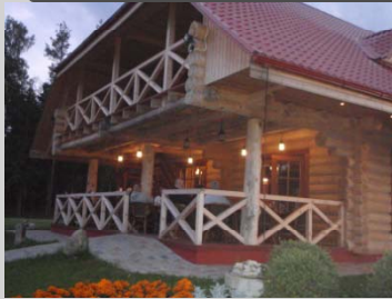
Ozianna camping Bygga i timmer kan Letterna