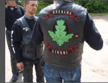
Guiden och byns enda b.....