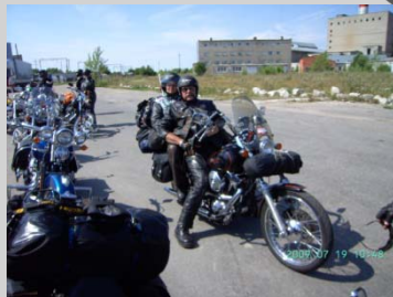
Snabbstopp mellan Tallin och Tartu