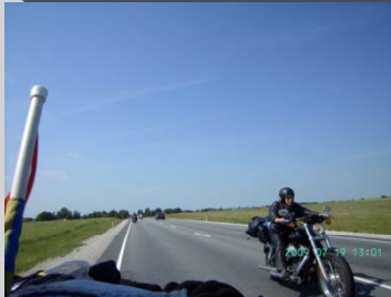
Hanna in action