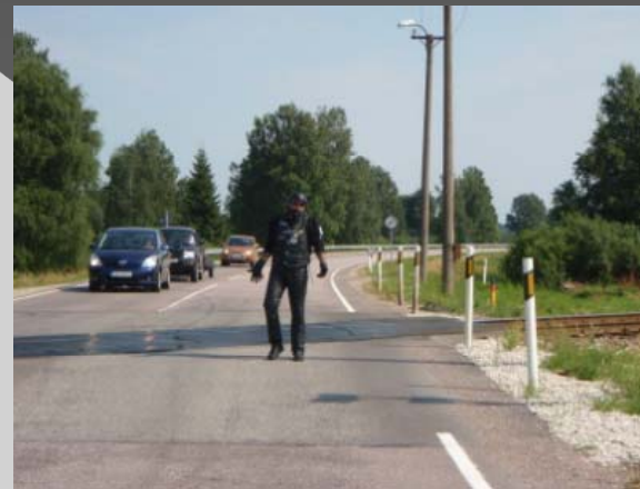
Rött ljus vid järnvägs korsning, Bodygarden (Normus) framme och skall stoppa tåget