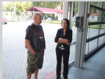
Ett eget militärmuseum hade ägaren till hotellet, Andris var mer intresserad av .....