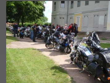
De kulturella inslagen på resan var mycket mer är kyrkor