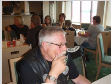
På färjan till Tallin. Svårt beslut! Vad ska jag dricka till maten, en sån ellerr två sånna.....