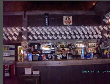
Restaurang Gun Powder i Tartu, stamgäster har egen ölsejdel