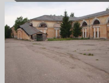
Rysk stolthet inte ens Napoleon klarade att inta denna försvarsborg