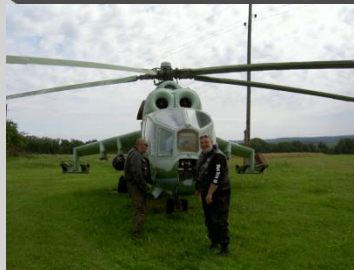
Mitt ute i obygden, en rysk attackhelikopter