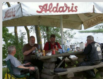
Lugnet har inträtt efter att Billa o Tomas konstatera att Harley inte går att använda till speedway