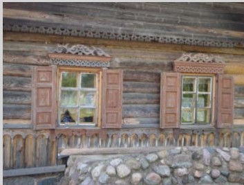
Fascinerande gamla byggnader,