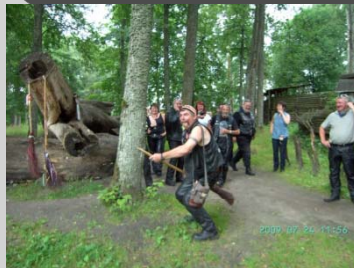
Uldevene vikingaby Billa hittar surrogat till ELA