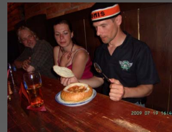
Vad i hela fr..... har jag beställt