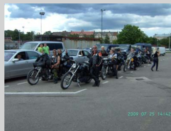
Hemdags, usch vad en vecka går fort,