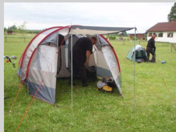
Kontrasternas tält trots att bägge åker HARLEY