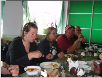
Rysk luxuös trerätters lunch avnjöts, men fy för dadeldrickat. Nära russkijj border