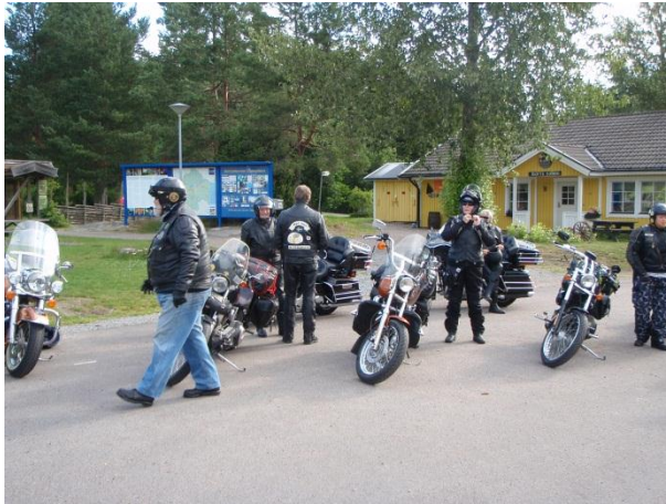
Samling och start Kårtoorp.

Den 16/7 2011 samlades 9st. Hot Iron medlemmar på 8st. mc för en 400:a mila tripp till Tyrolen.